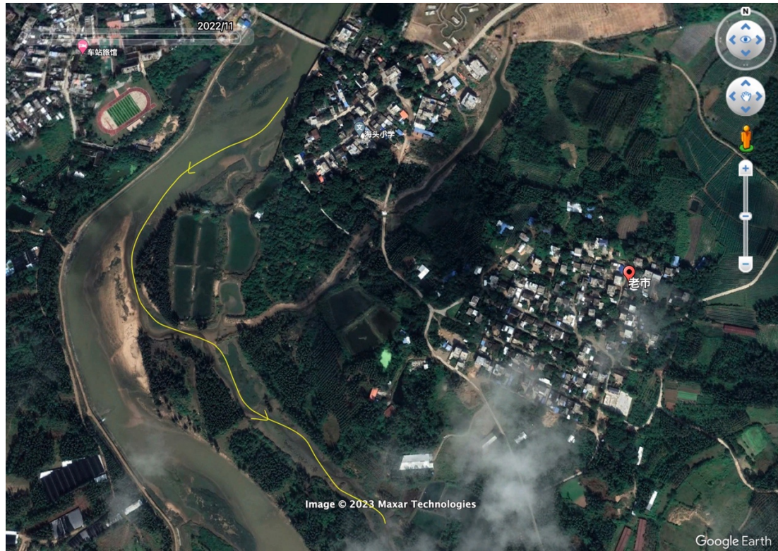
图 2-1 调查区域和路线